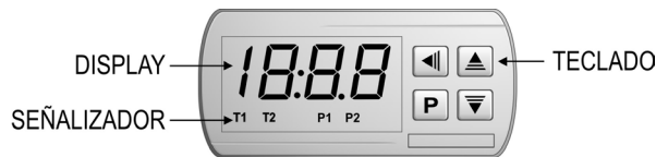
Figura 2 – Panel frontal del controlador

En el panel frontal del controlador el señalizador P1 enciende cuando la salida de control es ligada. El señalizador P2 enciende cuando la salida de apoyo es ligada.